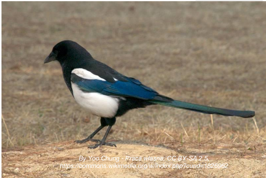
By Yoo Chung - Praca własna, CC BY-SA 2.5, https://commons.wikimedia.org/w/index.php?curid=1826962