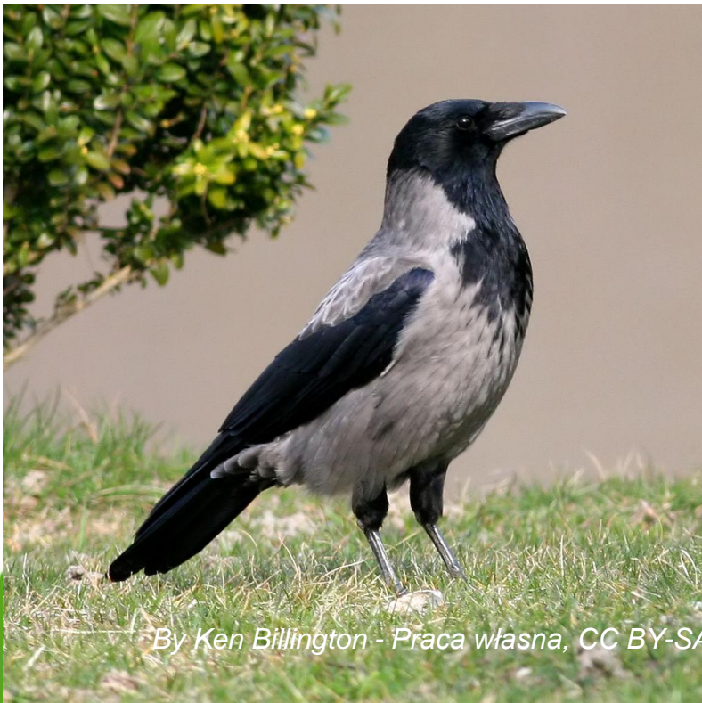
By Ken Billington - Praca własna, CC BY-SA